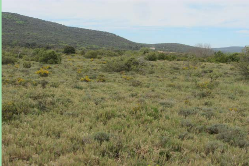
Une zone engagée en mesure agro-environnementale