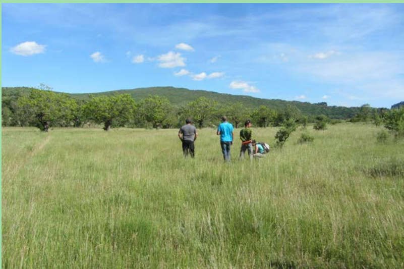
Le jury visitant une parcelle du concours prairies fleuries 2015

Le document de gestion du site Pic Saint-Loup, es communautaire, 5 espèces d'insectes, 2 de poissons 20 de ces mesures sont de priorité très forte. En tro