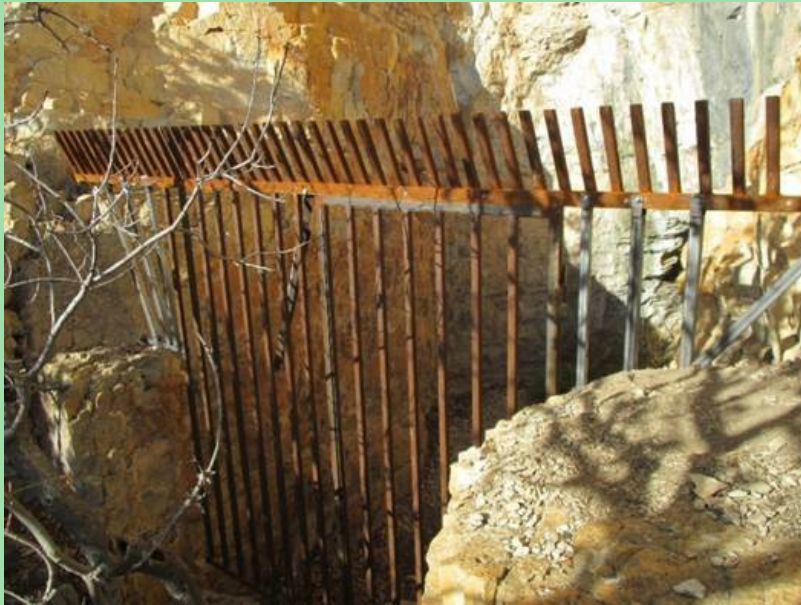
Le contrat de fermeture d'une cavité