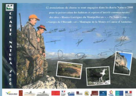
La Charte Natura 2000 signée par les chasseurs

Les sociétés de chasses communales de Buzignargues, Galargues, Mas de Londres, Montaud, Montpeyroux, Sainte-Croix-de-Quintillargues, Saint-Bauzille-de-Montmel, Saint-Guilhem-le-Désert, Saint-Martin-de-Londres et Saint-Mathieu-de-Trévières ont toutes été signataires en 2015. D'ores et déjà des contacts ont été pris avec d'autres sociétés de chasse pour poursuivre cet engagement des chasseurs en 2016.