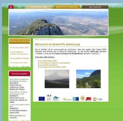
Une des pages du site Internet

Si cet outil permet de mettre à jour régulièrement les actualités du site, c'est aussi un moyen pour toute personne souhaitant participer, de s'informer et de contacter facilement l'animateur Natura 2000.