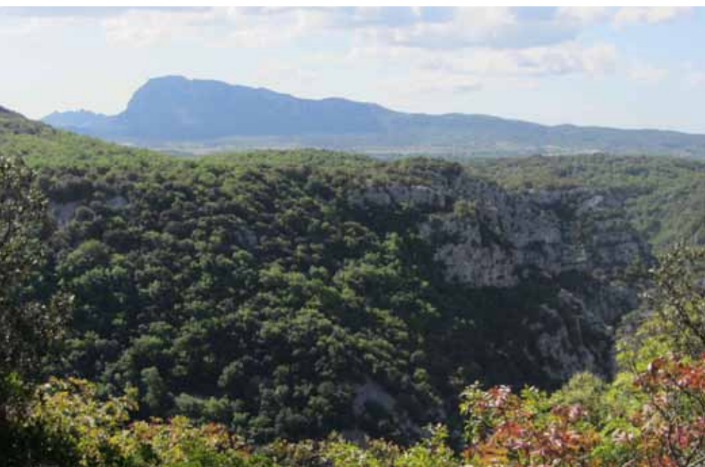
Versants sur lesquels la garrigue se densifie