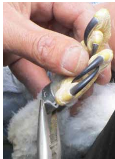
Baguage d'un jeune Aigle de Bonelli

Un diagnostic écologique et socio-économique a été réalisé dans le Document d'objectifs du site. Une mise à jour de ces informations doit être faite régulièrement et certaines informations précisées.