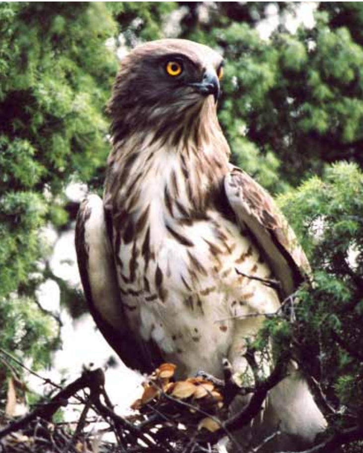
Le Circaète Jean-le-Blanc

J e suis un grand rapace qui peut atteindre 1,80 m d'envergure. Mon plumage est brun foncé au dessus, et blanc en dessous. On devine des tâches sur mon corps mais mon signe le plus remarquable est surtout la présence de trois barres sombres sur le bout de ma queue . De près, vous verrez mes yeux jaunes orangés et mon bec relativement court, qui me donnent des allures de chouette. De loin, vous me confondrez souvent avec la Buse variable ou l'Aigle de Bonelli. Pourtant je suis un type de rapace bien particulier ; mon régime alimentaire se compose principalement de serpents. Lorsque je chasse, il n'est pas rare de me voir effectuer un vol stationnaire, contre le vent, appelé « vol du saint-esprit ». Enfin, sachez que je niche dans un arbre , et non en falaise, comme de nombreux autres rapaces. Je suis une espèce menacée car en augmentant la taille de vos villes et en modifiant vos pratiques agricoles, vous faites disparaître mes proies et, par conséquent, je n'arrive plus à me nourrir. Pourtant j'ai toute ma place dans la chaîne alimentaire ! Et vous, qui n'aimez pas les serpents, je pourrais être un de vos grands amis !