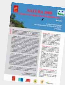
La lettre d'information n° 1

(1) Agriculteurs, forestiers, chasseurs, associations de loisirs de pleine nature.