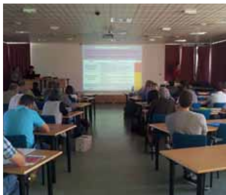
Réunion du comité de pilotage

(1) Végétation bordant les milieux aquatiques (ruisseau, cours d'eau...)