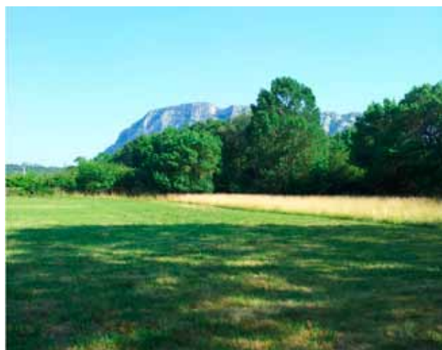
Mise en défens d'une prairie

Dès 2013, huit hectares ont été engagés dans ce type d'action. Or, lors d'une visite de terrain réalisée fin juillet par le Conservatoire des Espaces Naturels, quelle ne fût pas la surprise des naturalistes d'observer à quelques centimètres seulement de la limite de coupe un cocon de chenille de Damier de la Succise en plein développement ! Sans la contractualisation de cette mesure, la totalité de la prairie aurait été fauchée et le cocon de chenille n'aurait pu se développer.