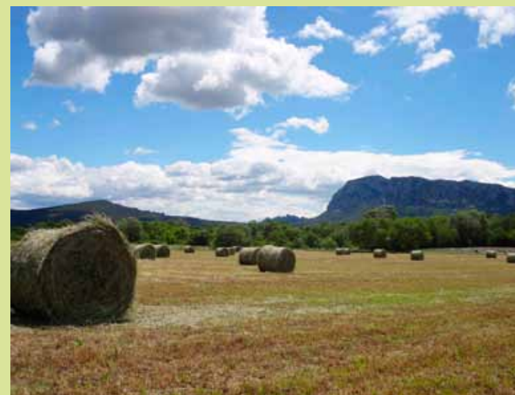
Récolte de fourrage sur la bassin de Londres

3 CONTRATS AGRICOLES SIGNÉS EN 2013 SUR 222 HECTARES, SOIT 15% DE LA SURFACE AGRICOLE EXPLOITÉE