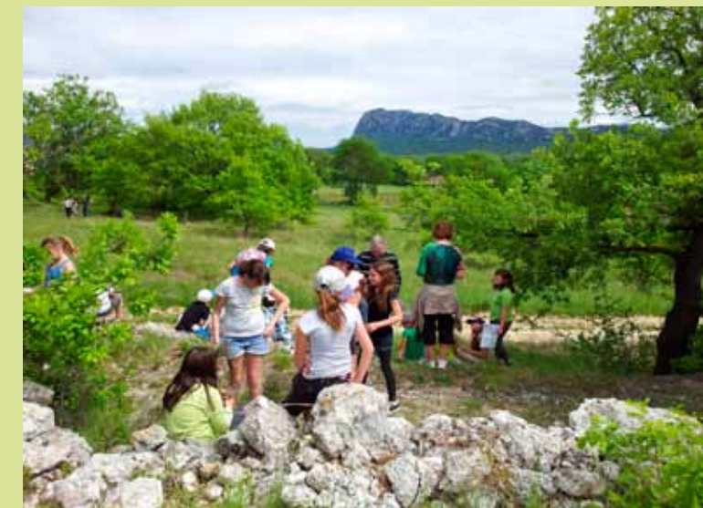
Sortie de terrain avec les CM2 de Saint-Martin-de-Londres