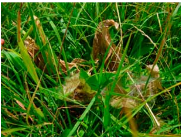
Le cocon du Damier de la Succise

Je suis un papillon de couleur marron dont les ailes sont pourvues d'un damier orange. Sur mes ailes postérieures, on reconnaît mon signe caractéristique : des points noirs alignés.