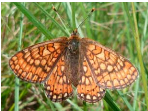
Le Damier de la Succise